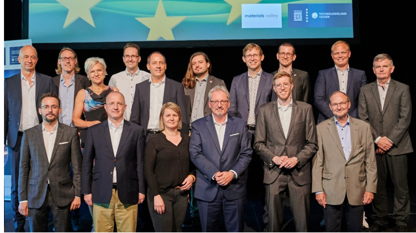
14.7.2023: Abschlußveranstaltung Materials to RePower EU - Innovationen für die Wasserstoffwirtschaft im CPH